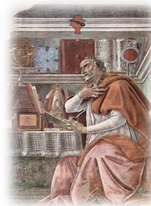
Saint Augustin (354-430)

né à Thagaste (actuel Souk-Ahras, Algérie)